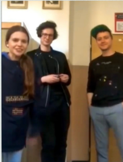
KAPELA I LOVE YOU HUNNY BUNNY